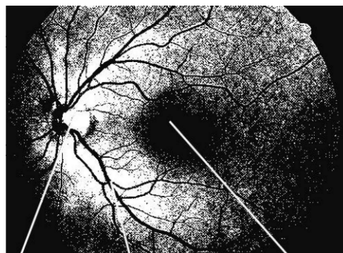
Зрительный нерв Сосуды сетчатки Макула