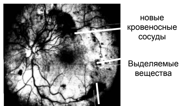
Новые кровеносные сосуды

Во время сеанса вы должны будете сидеть у аппарата, подобного тому, каким пользуется глазной врач для проверки глаз. Во время сеанса голова должна быть неподвижна.