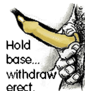
Hold base... withdraw erect.