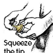
Squeeze the tip.