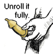
Unroll it fully.