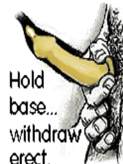
Hold base... withdraw erect.

반드시 수성 윤활제를 사용합니다. 기름이나 바셀린을 사용하면 안됩니다. 섹스 도중 콘돔이 빠지지 않았는지 확인합니다.