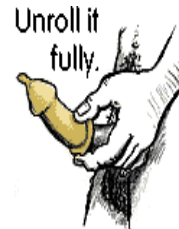
Unroll it fully.