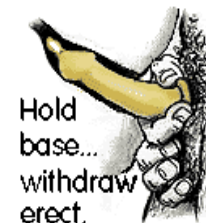
Hold base... withdraw erect.

섹스 도중 콘돔이 빠지지 않았는지 확인합니다. 끝난 후에는 음경이 여전히 발기된 상태에서 뺍니다. 뺄 때는 콘돔이 같이 나오도록 내용물이 흘러나오지 않도록 콘돔의 밑부분을 잡고 뺍니다. 콘돔은 일회용입니다.