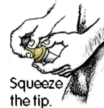
Squeeze the tip.

편안하게 맞는 브랜드를 선택합니다. 포장을 뜯을 때 치아를 사용하지 않도록 합니다. 콘돔을 손톱으로 찢는 일이 없도록 주의합니다. “사용 유효” 날짜를 확인합니다.