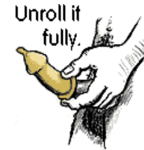
Unroll it fully.

콘돔의 끝부분을 잡고 누른 후 발기된 음경 위에 펼칩니다. 포경수술을 하지 않은 경우에는 포피를 뒤로 잡아당기고 펼칩니다. 콘돔을 음경의 밑부분까지 완전히 펼칩니다.