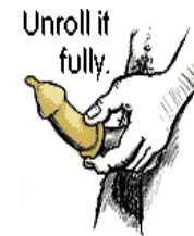
Unroll it fully.