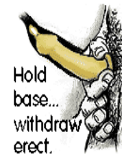
Hold base... withdraw erect.