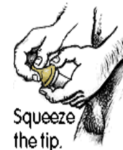
Squeeze the tip.