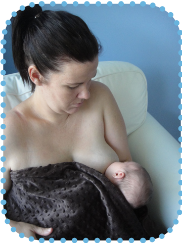
마돈나식 안기 (전통적)