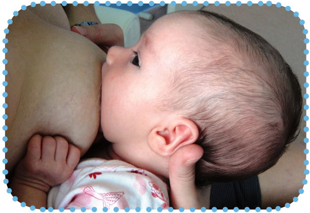
트윈 스타일 또는 풋볼식 안기